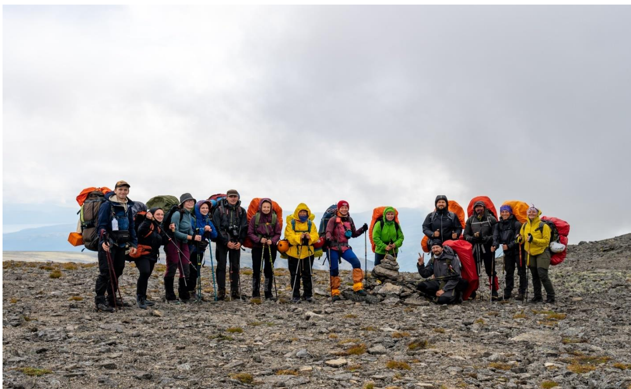
Фото 36: Группа на седловине перевала Академический.

Тропа хорошая, идти комфортно, но очень сильный ветер. Ещё за два перехода подошли к седловине перевала Академический (фото 36) к 12:00, поднявшись на высоту 1075 метра. Сфотографировались у турика.