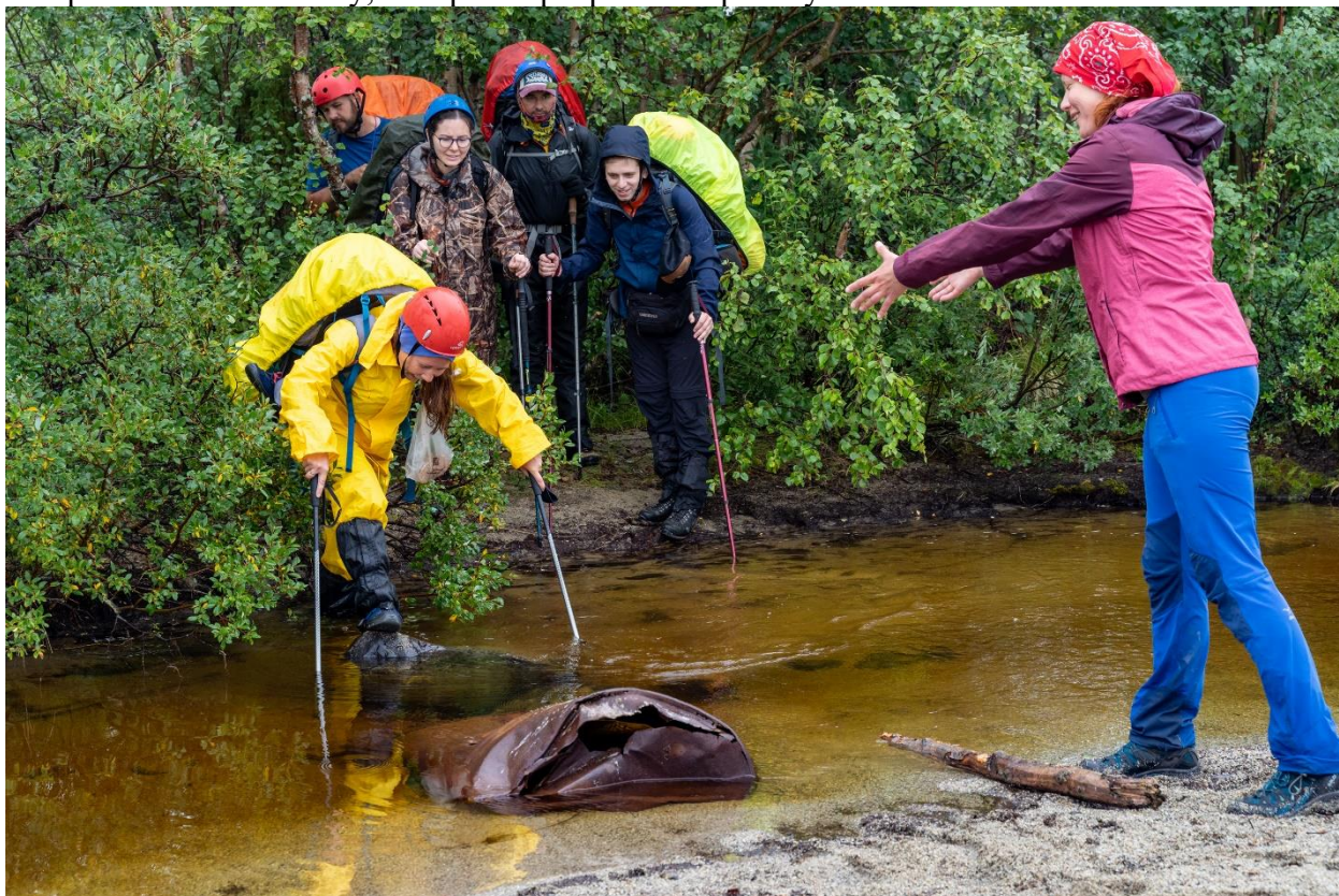
Фото 26: Протока между озером Пасьявр и заливом Тульилухт.

Подъём в 07:00, выход в 09:00. Погода с утра +14, временами дождь, временами солнце, переменная облачность. За два перехода по хорошей удобной просёлочной дороге подошли к протоке, соединяющей озеро Пасьявр и залив Тульилухт в 10:45 (фото 26). Протока шириной 3-4 метра и глубиной 30-50 см, у самого её впадения в залив частично перекрыта железобетонными трубами, бочками, но всю протоку они не перекрывают, от крайней трубы до правого берега протоки примерно 1,5 метра. Переправлялись страхуясь палками и перескакивая на бочку, которая перекрывала протоку частично.