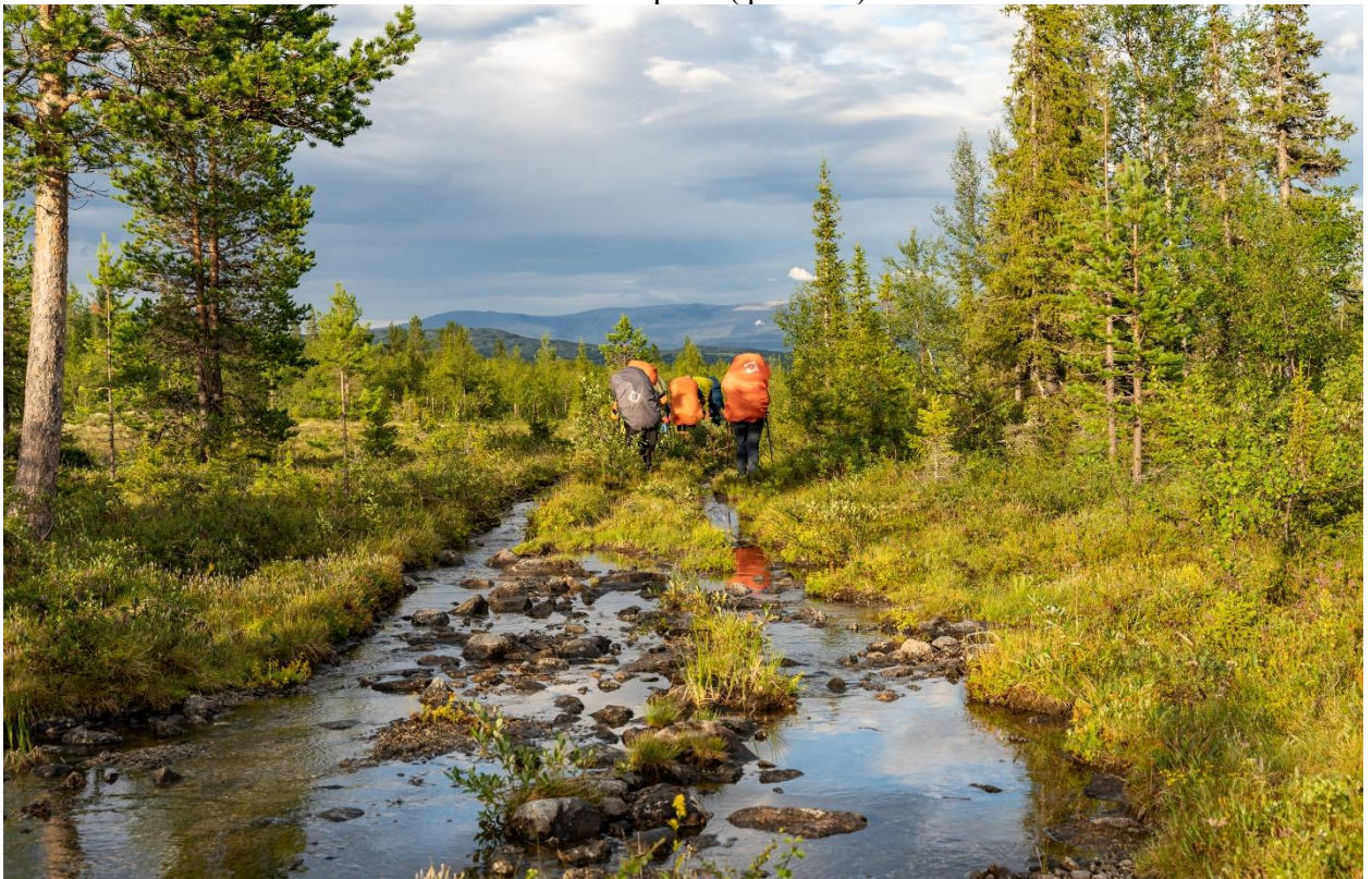
Фото 23: Дорога, пересечённая руслом ручья при спуске по левой стороне долины Майвальтайок.

После привала, в 17:00 начали движение к озеру Верхний Ньюръярв, по тропе по левобережной части долины. Через километр тропа сильно отклонилась и вывела на старую, уже заросшую просёлочную дорогу. В какой-то момент дорога превратилась в ручей, по которому бежала вода. По камням всё легко перешагивалось, ручей нисколько не мешал и в какой-то момент отклонился направо (фото 23).