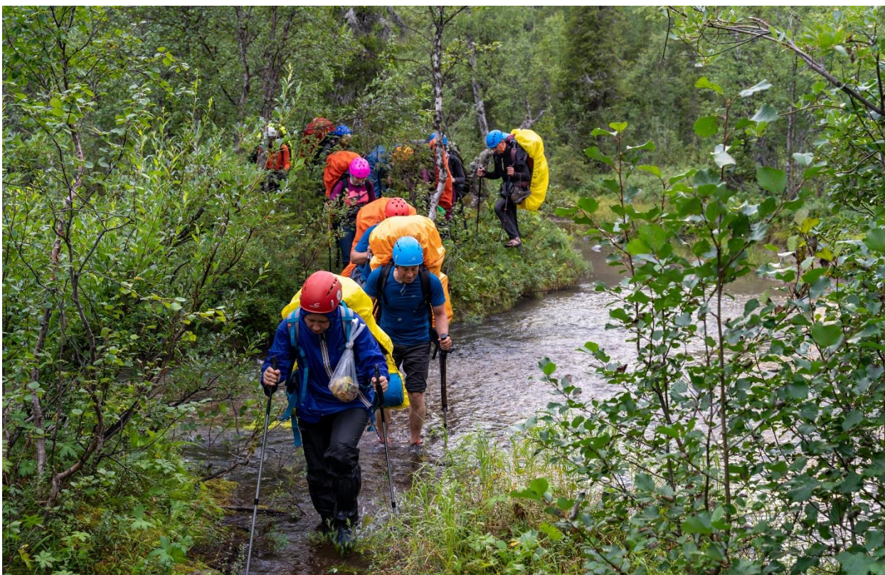
Фото 25: Переправа через второй левый приток реки Майвальтайок (н/к.)