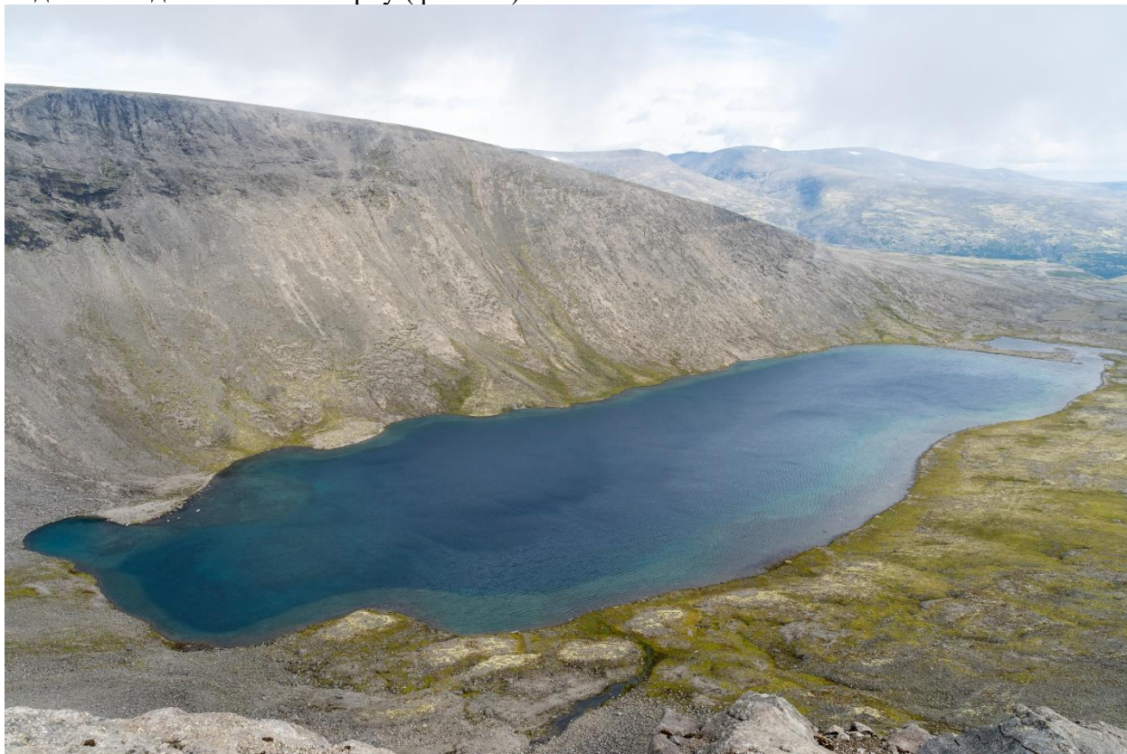
Фото 35: Оз. Академическое, вид сверху.

Набрав чуть менее 200 м, остановились на привал в точке, чтобы отдохнуть, полюбоваться видами Академического сверху (фото 35).