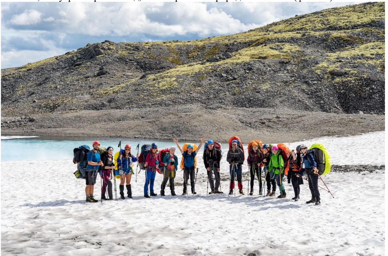
Фото 20: Группа на спуске с перевала Северный Партомчорр

На спуске, в направлении долины реки Майвальтайок мы обнаружили озеро, вокруг снежник, а внутри озера был лед, очень красивое природное явление (фото 20).