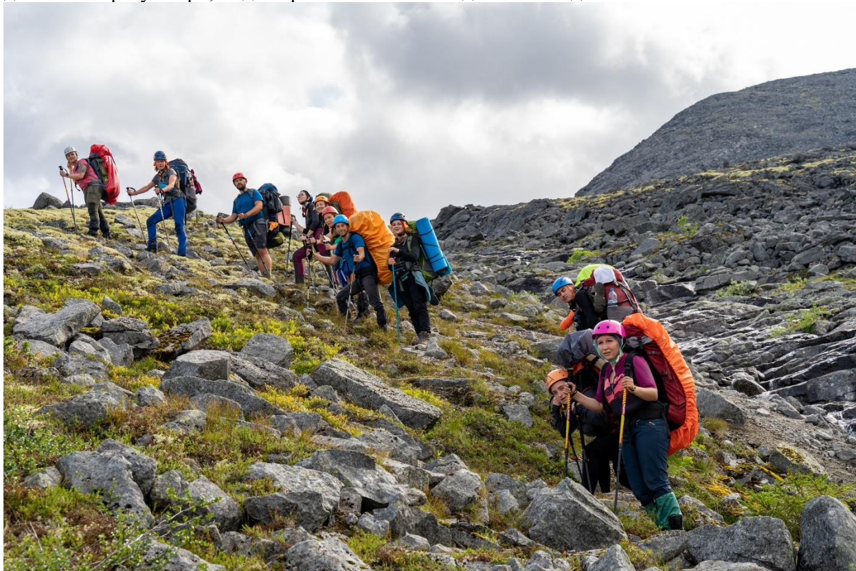
Фото 18: Группа на подъеме. Перевал Северный Партомчорр (н/к)

Подъём начали с правой стороны р. Лявойок, повернув налево к перевальному взлету, стали двигаться сразу вверх, видна тропа. Шли по ней до самой седловины.