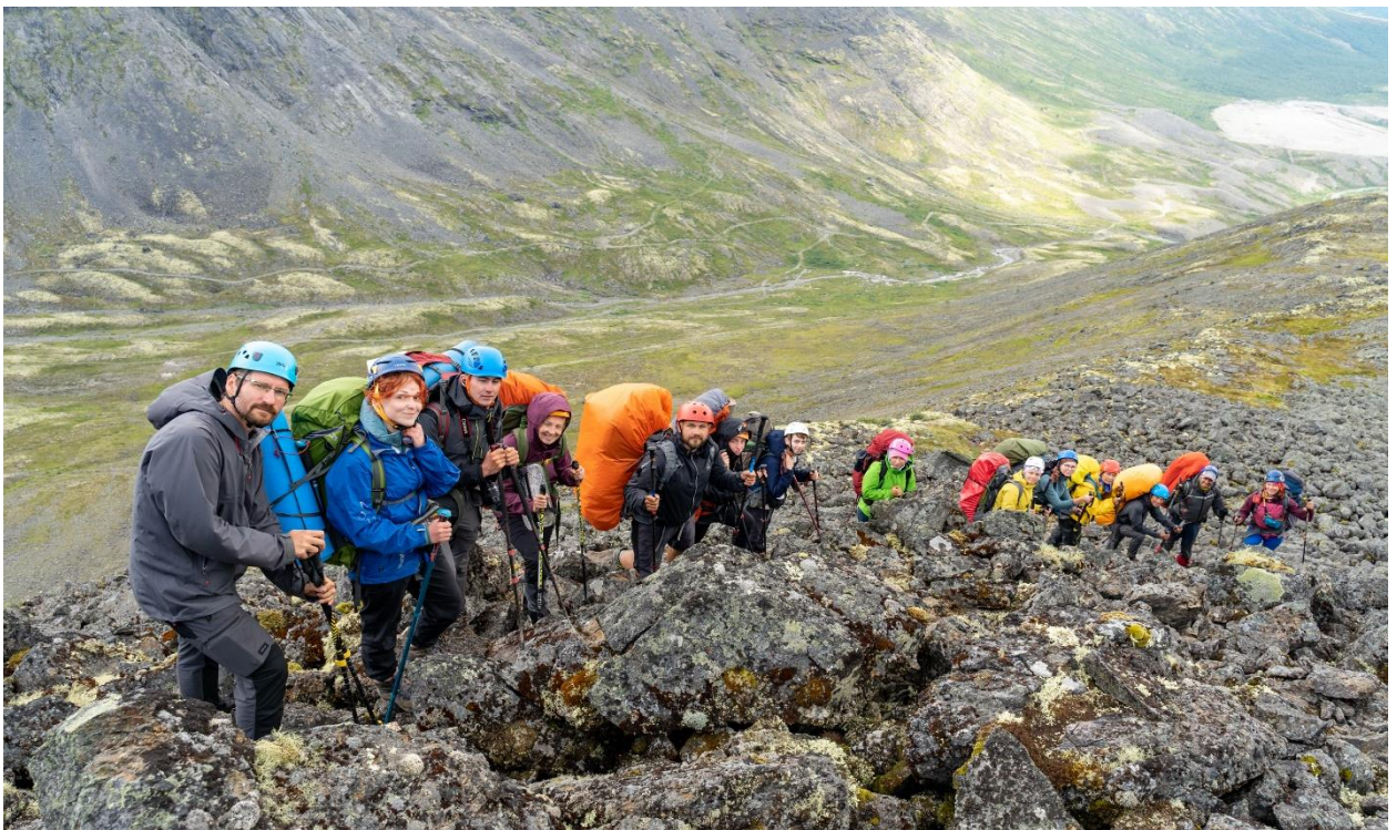
Фото 39: Траверс южного гребня плато Кукисвумчорр.

В 14:40 все прошли через сложный участок, далее отправились вниз по гребню. Погода к этому моменту значительно улучшилась, ветер почти стих, светило солнце. Немного спустившись, остановились на привал, чтобы переодеться.