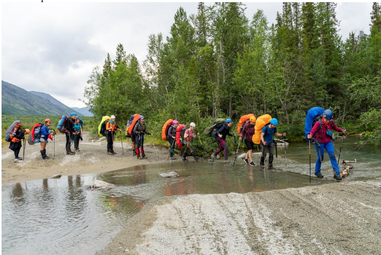
Фото 12: Ручей Партомйок.

В 12:00 подошли к базе КСС, где перешли Кунийок на правый берег по мосту, заодно отметились у спасателей и остановились на обед и купание, погода была солнечной. Затем за один переход от базы КСС по грунтовой дороге дошли до её пересечения с ручьём Партомйок (фото 12). Русло шириной 5 метров, уровень воды до 15 см, дно песчано-грунтовое, камни, течение слабое. Перепрыгнули по выходящим камням, а также быстрыми шагами пробежали по отмелям.