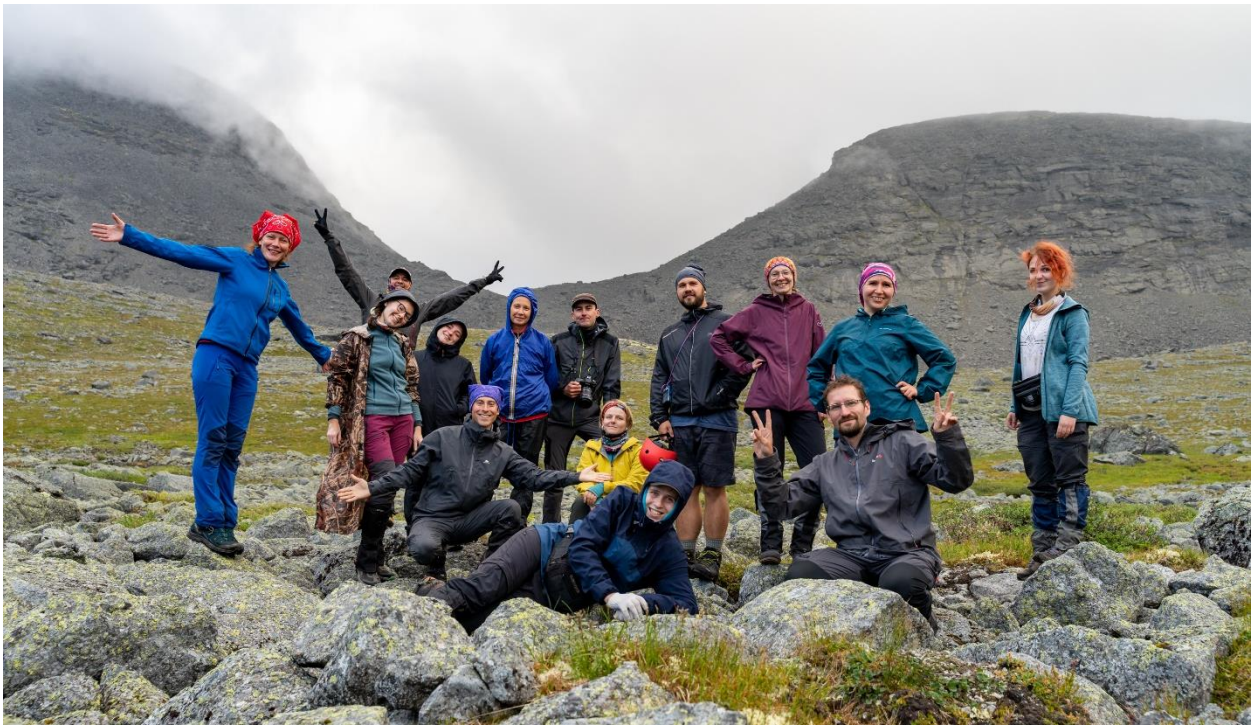
Фото 8: Группа у подножья перевала Чорргор Южный(н/к)

Перевал Южный Чорргор, высота 851 м, некатегорийный (фото 9).