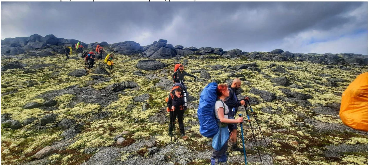
Фото 4: Траверс Северного склона горы Гольцовка

После привала направились по северному склону реки Гольцовка траверсом через небольшое озеро, которого нет на карте (фото 4).