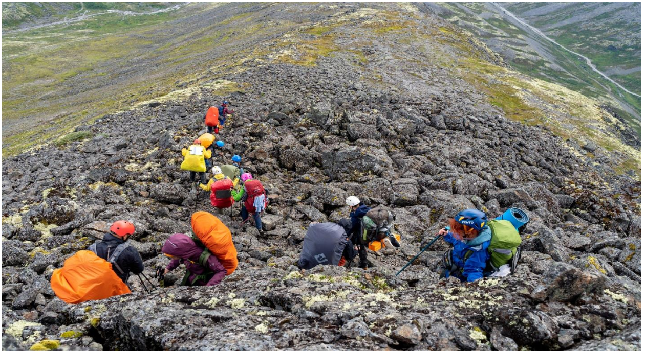
Фото 38: Траверс южного гребня плато Кукисвумчорр.