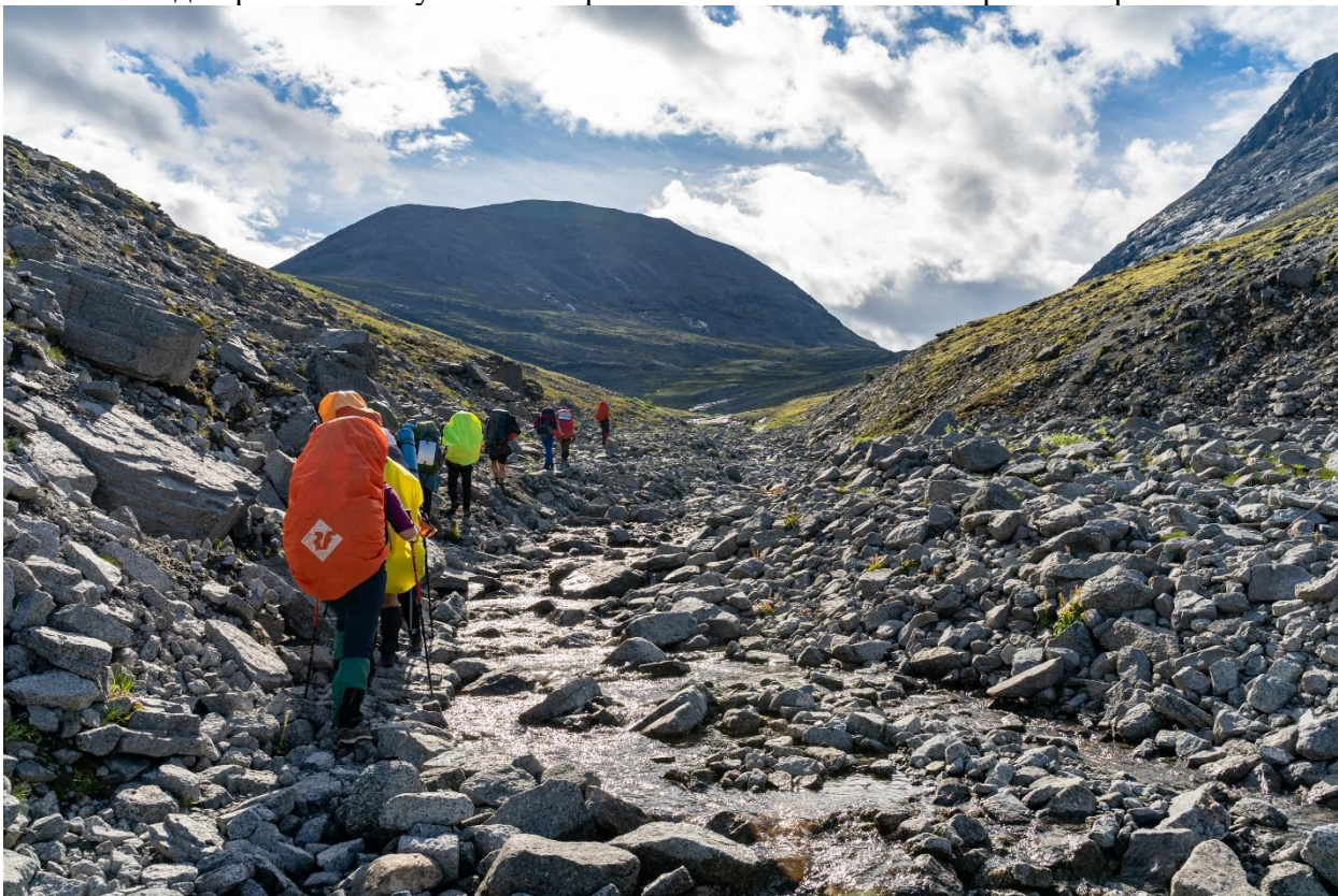
Фото 17: Подъем на перевал Партомчорр Северный (н/к)

Далее продолжили движение вдоль левого берега к истокам реки Лявойок и в направлении перевала Партомчорр Северный (фото17). Периодически пересекали русло слева направо, или вовсе идя прямо по нему. В итоге тропа вывела нас опять на правый берег