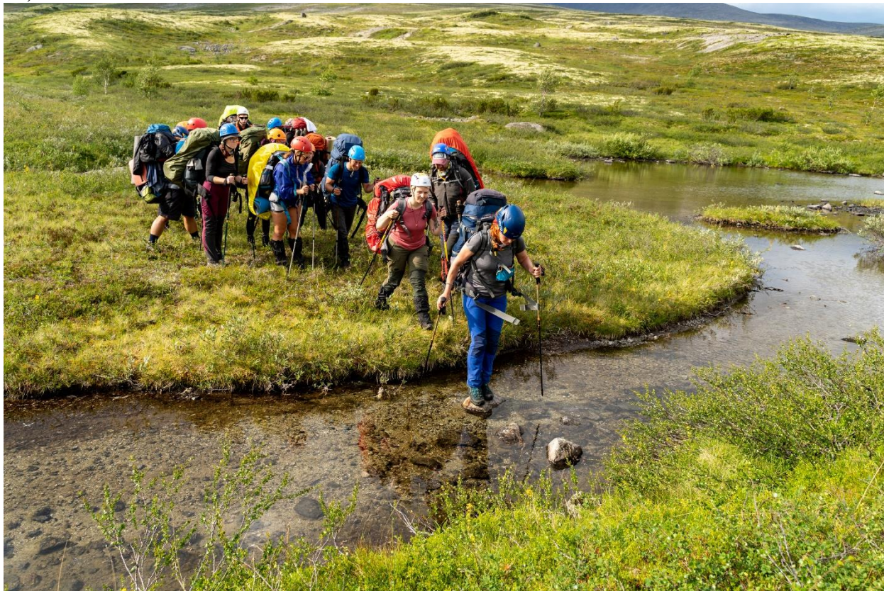
Фото 21: Переправа через русло Майвальтайок в болотистой части (н/к)

После обеда продолжили идти сначала по правому берегу, потом перепрыгнули на левый и далее придерживались левого борта долины реки. Следующие два километра шли по удобной пологой тропе, пока тропа плавно не растворилась в болоте, и дальнейшие метров сто мы продолжили, перешагивая по кочкам, пока не подошли к руслу. Русло шириной примерно 2 метра, уровень воды в этом месте до 40 сантиметров, течение очень слабое. Нашли участок с торчащими из воды камнями, и благополучно перешагнули по ним (фото 21).