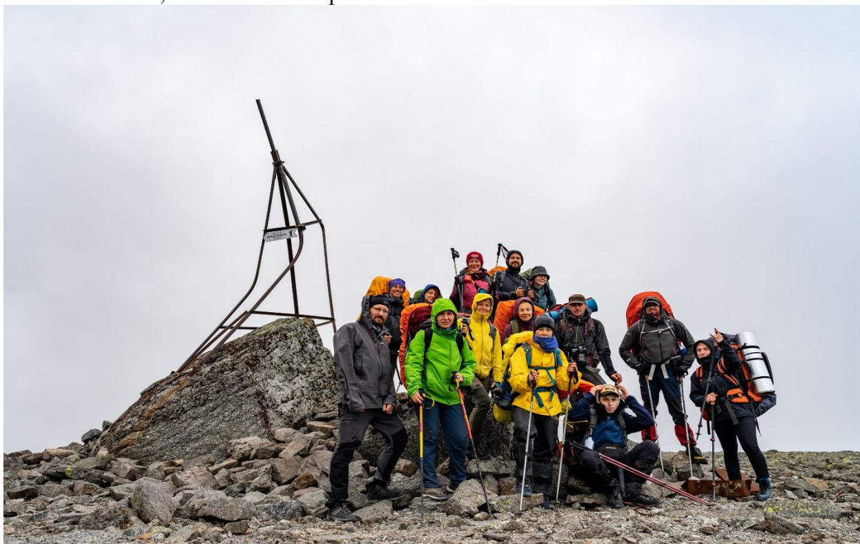
Фото 37: Группа на вершине Кукисвумчорр, (н/к).

Вершина Кукисвумчорр представляет из себя огромное плато. С вершины хорошо ловит мобильная связь, в том числе интернет.