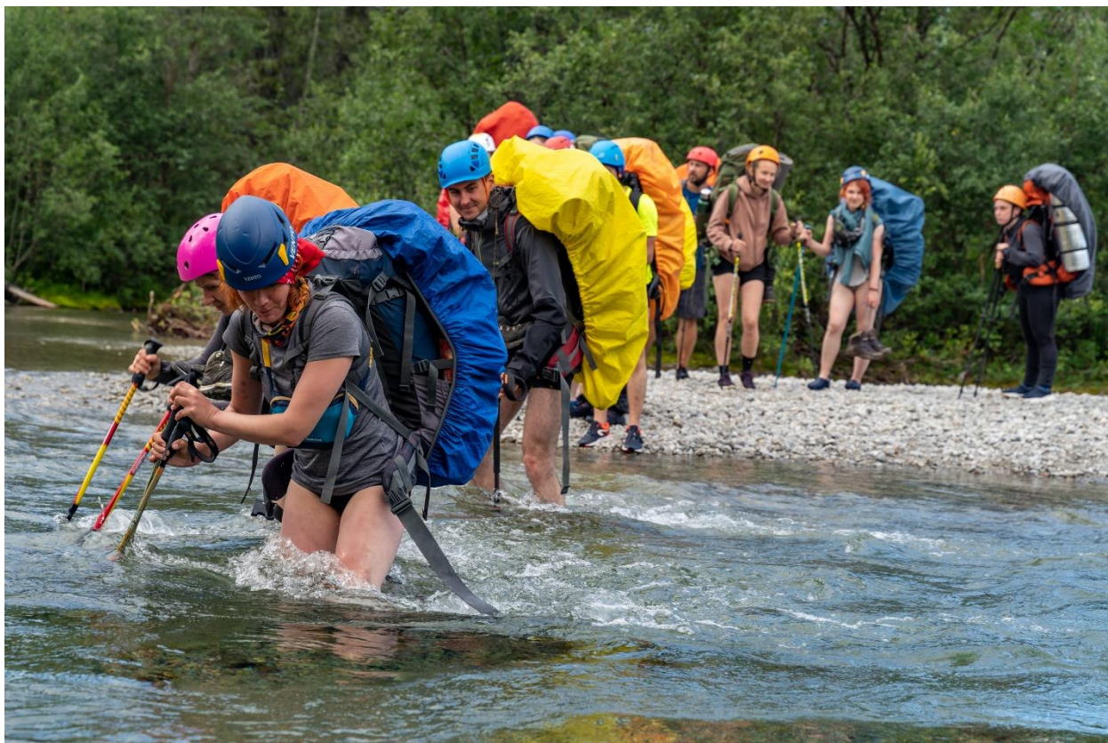
Фото 29: Брод через реку Касканюйок, (1А)

Русло в этом месте делится на два: первое совсем простое, а второе русло основное. Первый участок неглубокий, глубиной до 30 сантиметров, шириной примерно 15 метров (фото 29,30). Уровень воды в основном русле 60-90 сантиметров, ширина 10 метров, течение чуть выше среднего, вода прозрачная, дно каменистое, хорошо просматривается, встречаются подводные камни. Перешли по одному с самостраховкой сдвоенными палками. Наиболее сильное течение ближе к правому берегу.