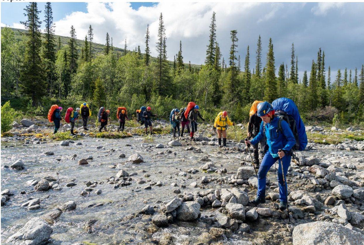
Фото 6: Брод левого притока реки Гольцовка в её верхнем течении, (н/к)

Река неглубокая, течение ниже среднего или среднее, глубина не более 30 сантиметров, вода прозрачная. Ширина русла примерно 7-10 метров. Брод некатегорийный (фото 6). Много камней, торчащих из воды, при помощи которых мы и переправились на другой берег.