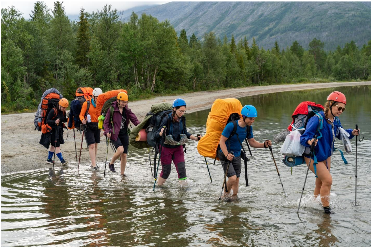
Фото 14: Брод протоки между озёрами Щучье и Гольцовое, (н/к.)

После перехода далее в обуви для бродов отправились по узкой песчаной береговой линии с юго-восточной стороны.