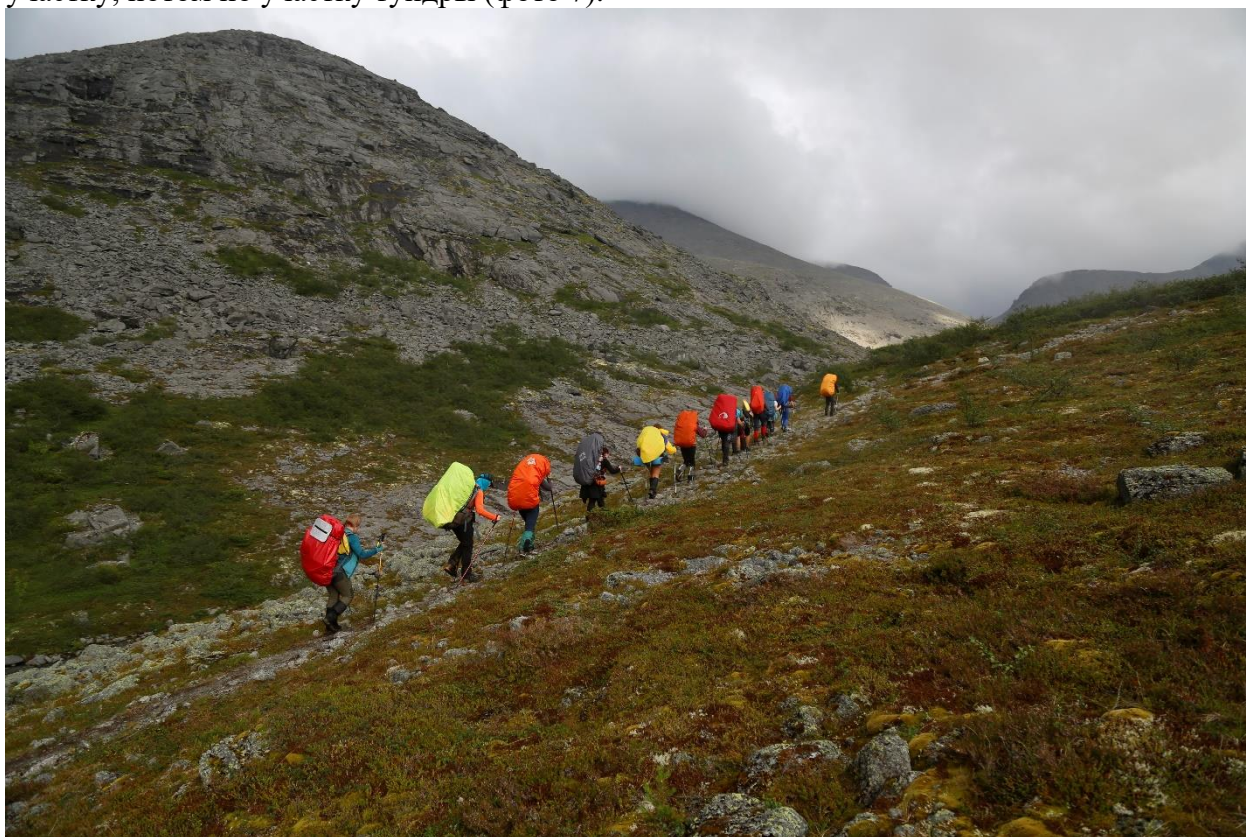
Фото 7: Группа на тропе в направлении к перевалу Южный Чорргор

Далее по левому берегу реки Часнайок, не пересекая ее, мы отправились в направлении перевала Чорргор Южный. До самого озера под перевалом идёт тропа, сначала по лесному участку, потом по участку тундры (фото 7).