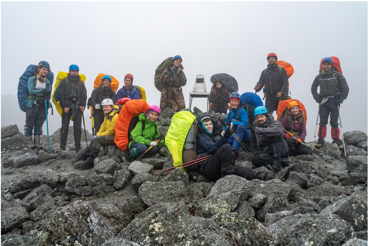
Фото 9: Группа на перевале Южный Чорргор(н/к)

Спустились с перевала в 21:30, в районе озера за перевалом сильный уклон, место под палатки пришлось поискать, поставили лагерь, ужин, отбой.