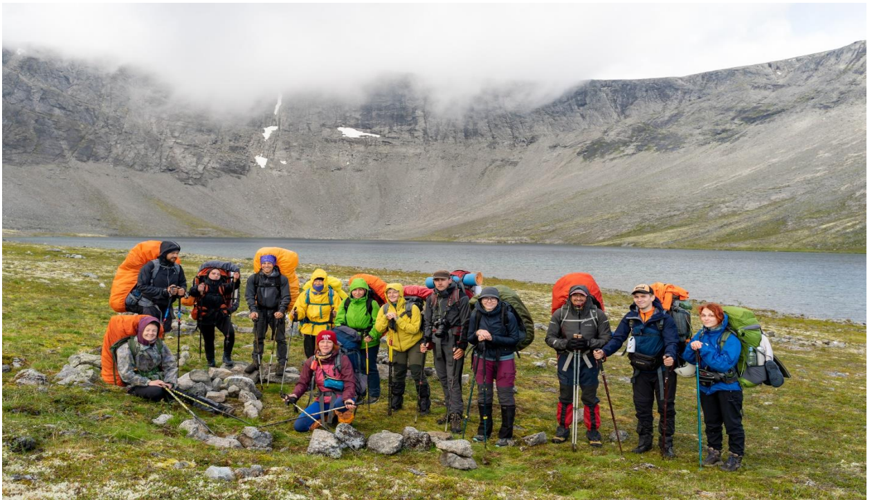
Фото 33: Группа у озера Академического

Лагерь поставили в 19:00. Приготовление ужина у озера. Общаемся, отдыхаем, любимся видами озера, гуляем по снежникам, делаем красивые фотографии. Отбой в 21:00.