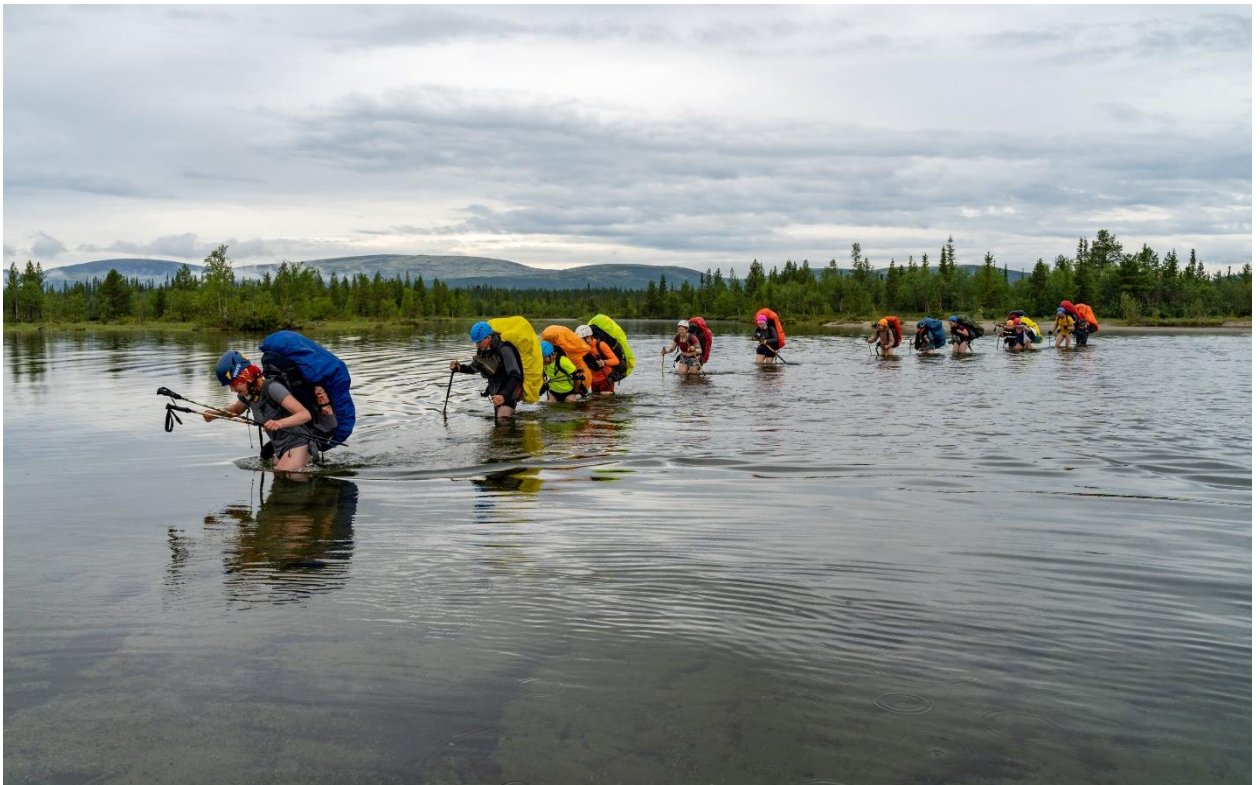
Фото 27: Брод через реку Майвальтайок в её устье в заливе Тульилухт, (1А.)

Переправились через реку всей группой за 20 минут. После водных процедур на правом берегу Майвальтайок остановились на привал согреться, утеплиться, отдохнуть и пообедать.