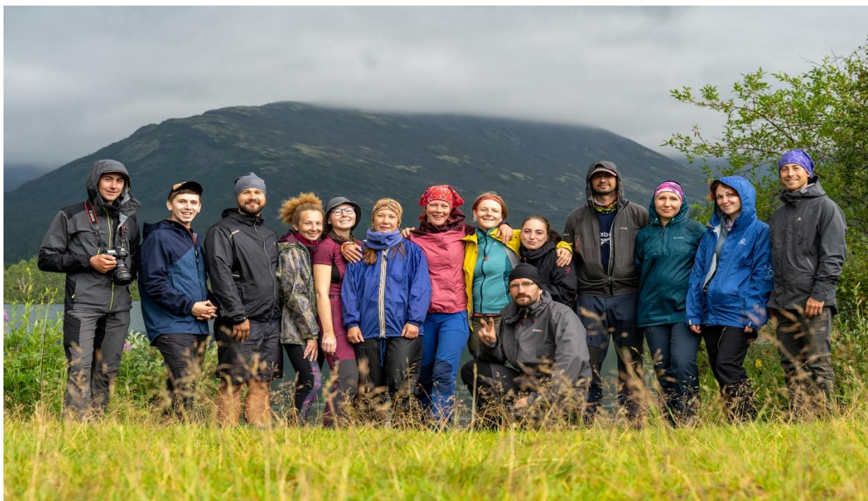
Фото 40: Группа в полном составе в последний день похода у оз. Малый Вудъявр

Подъём в 08:00, выход в 10:00. Погода +14, переменная облачность, небольшой дождь.