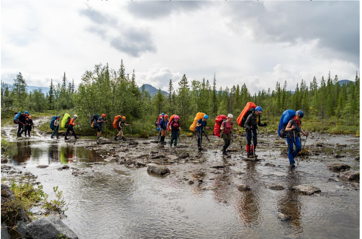
Фото 11: Левый приток реки Кунийок в месте её пересечения с дорогой.

Ещё за один переход по размытой дороге подошли к левому притоку реки Кунийок (фото 11). В этом месте ручей широко разливается, ширина русла до 10 метров, уровень воды до 10 см. В этом месте через ручей проходит просёлочная дорога. Перешли по нему по камням.