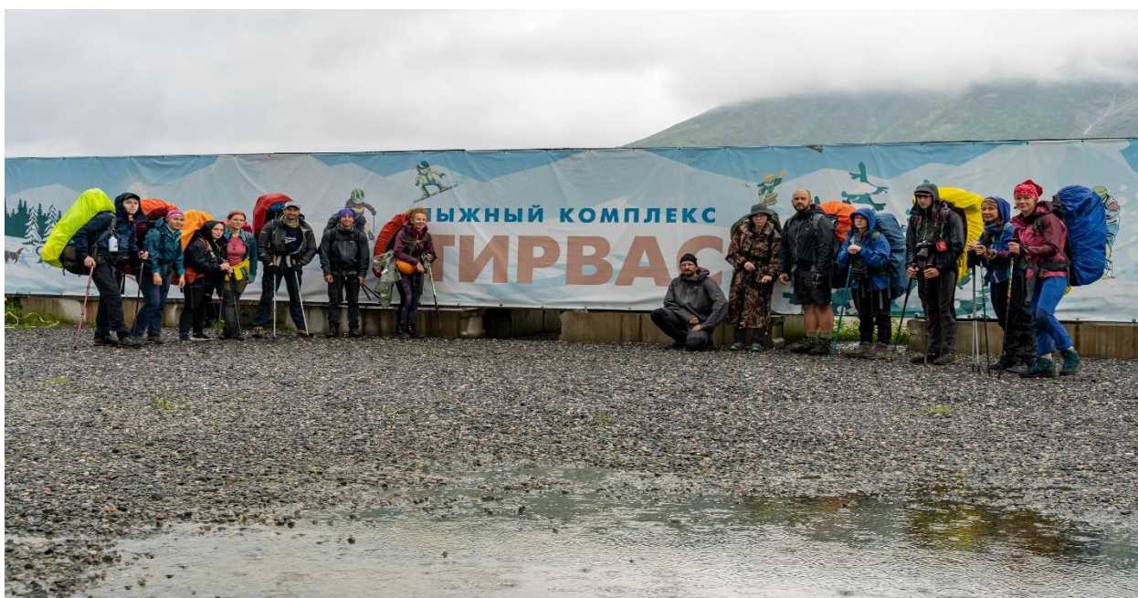
Фото 41: Группа в полном составе у спортивно-оздоровительного комплекса «Тирвас»

Менее чем за час вышли к спортивно-оздоровительному комплексу «Тирвас» (фото 41).