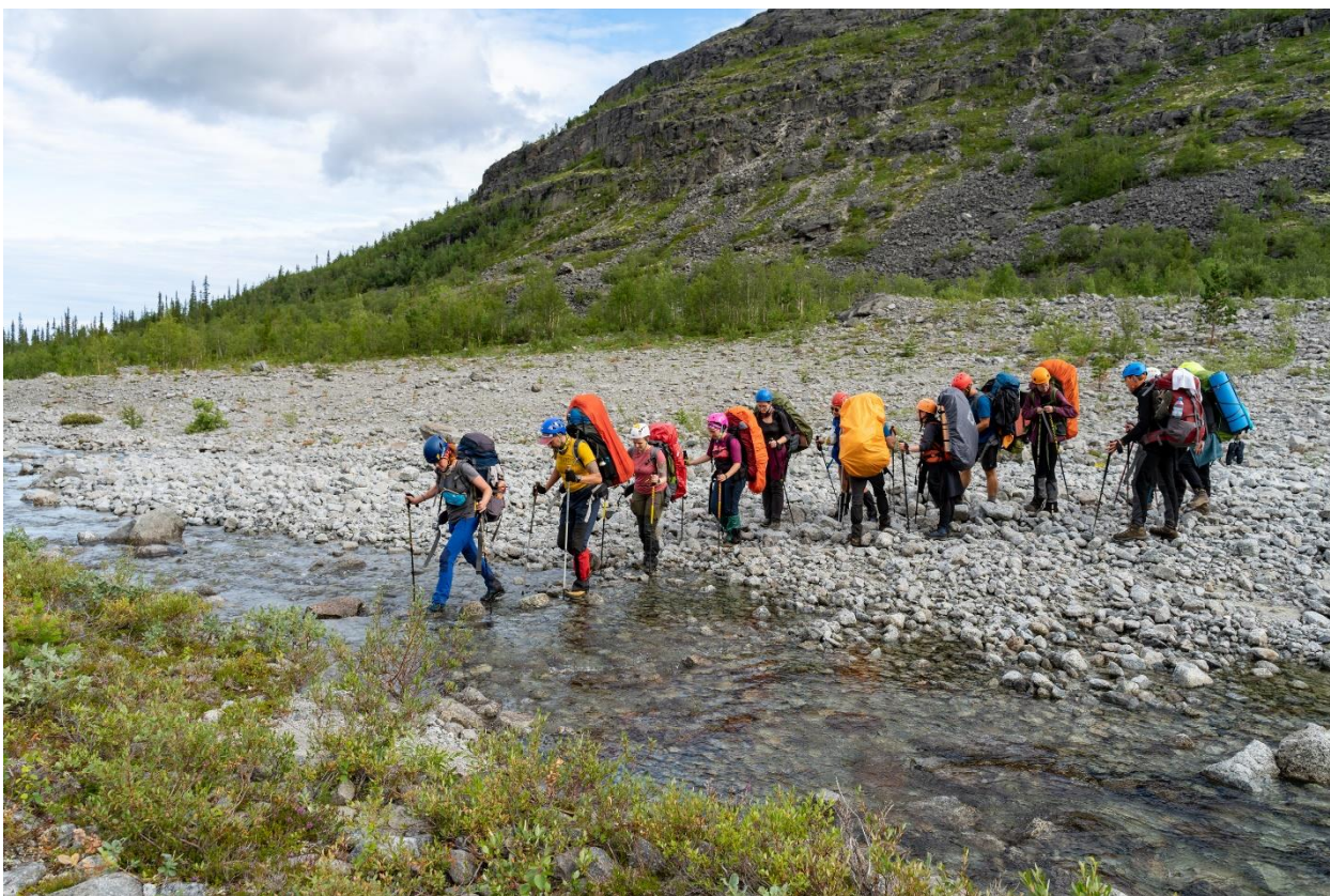
Фото 16: Переправа через Лявойок в её среднем течении, (н/к.)

Далее продолжили движение вдоль левого берега к истокам реки Лявойок и в направлении перевала Партомчорр Северный (фото17). Периодически пересекали русло слева направо, или вовсе идя прямо по нему. В итоге тропа вывела нас опять на правый берег