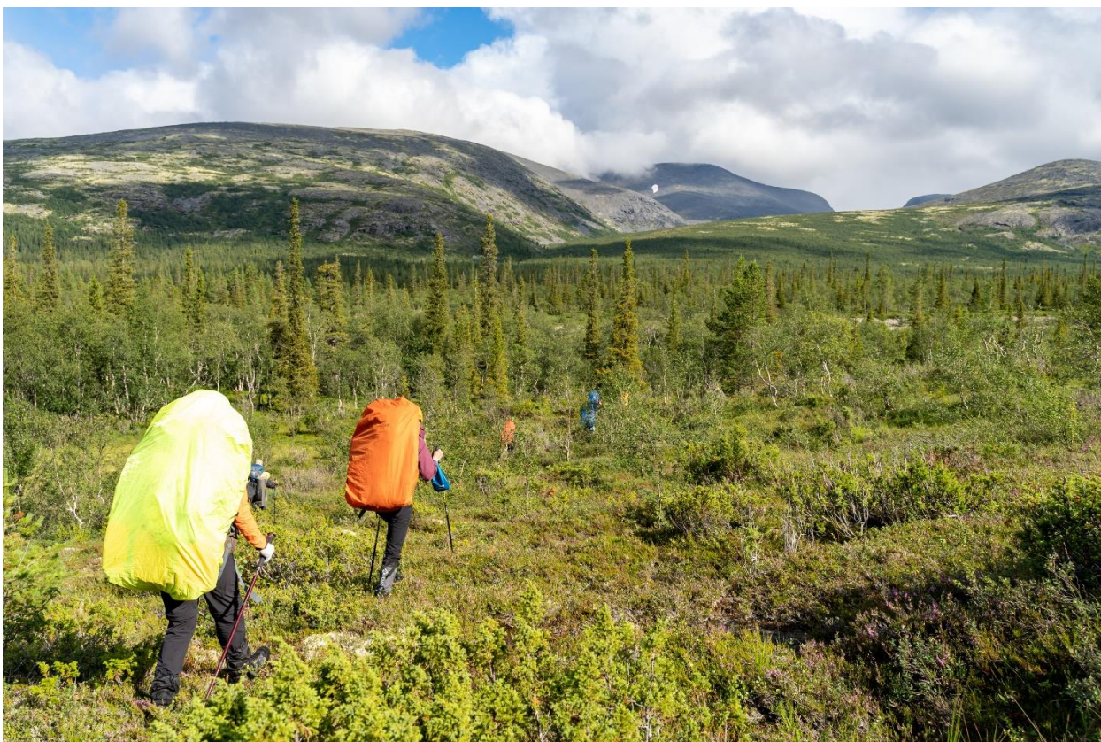
Фото 5: Переход лесного участка, движение азимутом к левому притоку реки Гольцовка.

Река неглубокая, течение ниже среднего или среднее, глубина не более 30 сантиметров, вода прозрачная. Ширина русла примерно 7-10 метров. Брод некатегорийный (фото 6). Много камней, торчащих из воды, при помощи которых мы и переправились на другой берег.