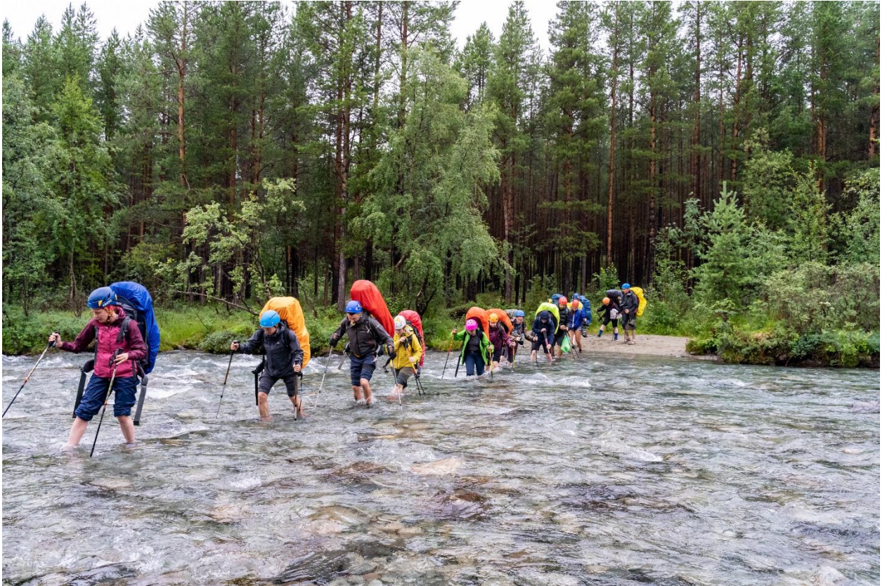
Фото 2: Брод реки Гольцовка в нижнем течении.

Дальнейший участок пути проходил по менее удобной размытой просёлочной дороге вдоль ЛЭП, часто пересекаемой ручьями, возможно, временными.