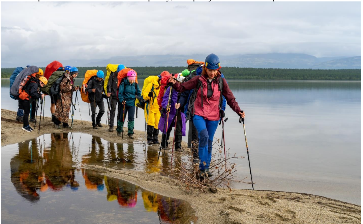
Фото 28: Протока, соединяющая безымянное озеро и залив Тульилухт.

Около 13:30 всё так же по берегу залива подошли к очередному препятствию, протоке, соединяющей безымянное озеро и залив Тульилухт (фото 28). Неширокая и неглубокая протока, шириной 1,5 метра, глубиной 5-15 сантиметров, течение слабое. Дно песчаное, но вязкое. Прошли по песчаной косе и бревну, которое уже лежало на протоке.