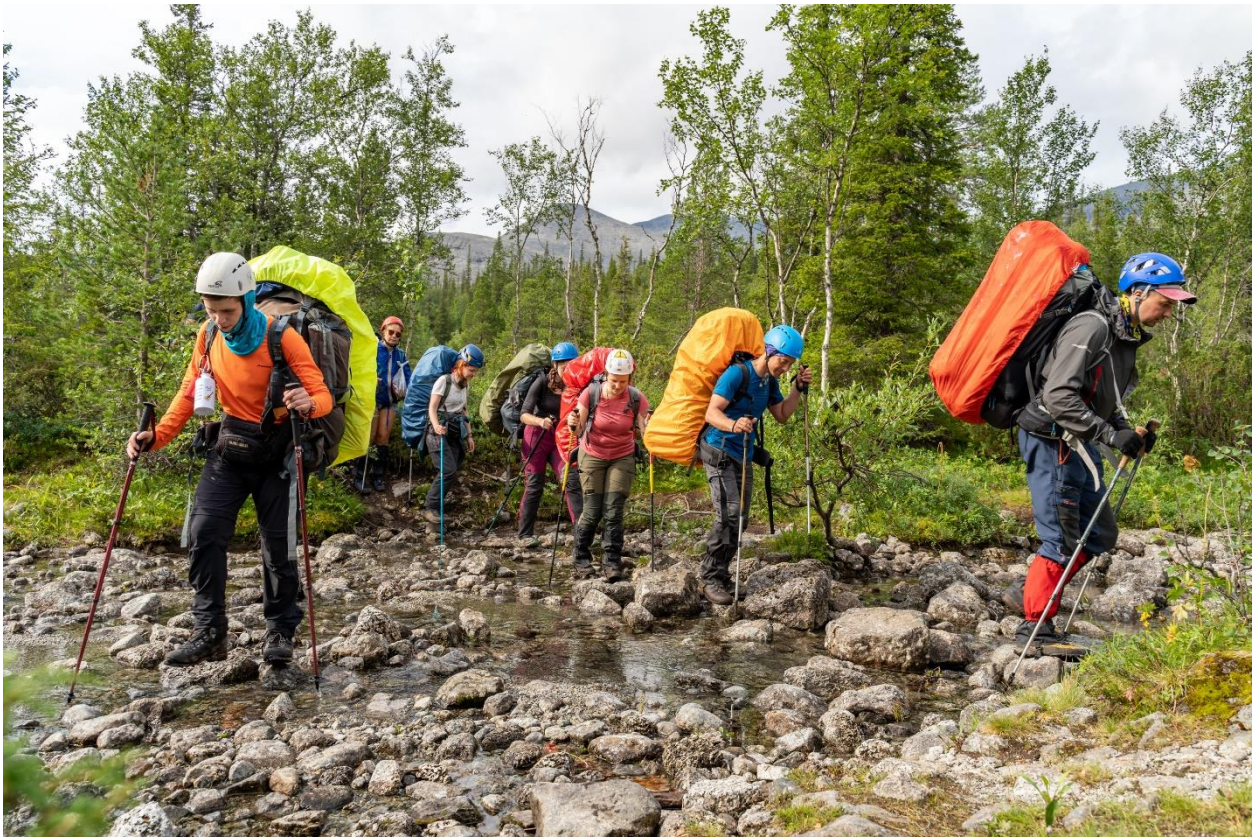
Фото 10: Левый приток ручья Петрелиуса.

Ещё за один переход по размытой дороге подошли к левому притоку реки Кунийок (фото 11). В этом месте ручей широко разливается, ширина русла до 10 метров, уровень воды до 10 см. В этом месте через ручей проходит просёлочная дорога. Перешли по нему по камням.