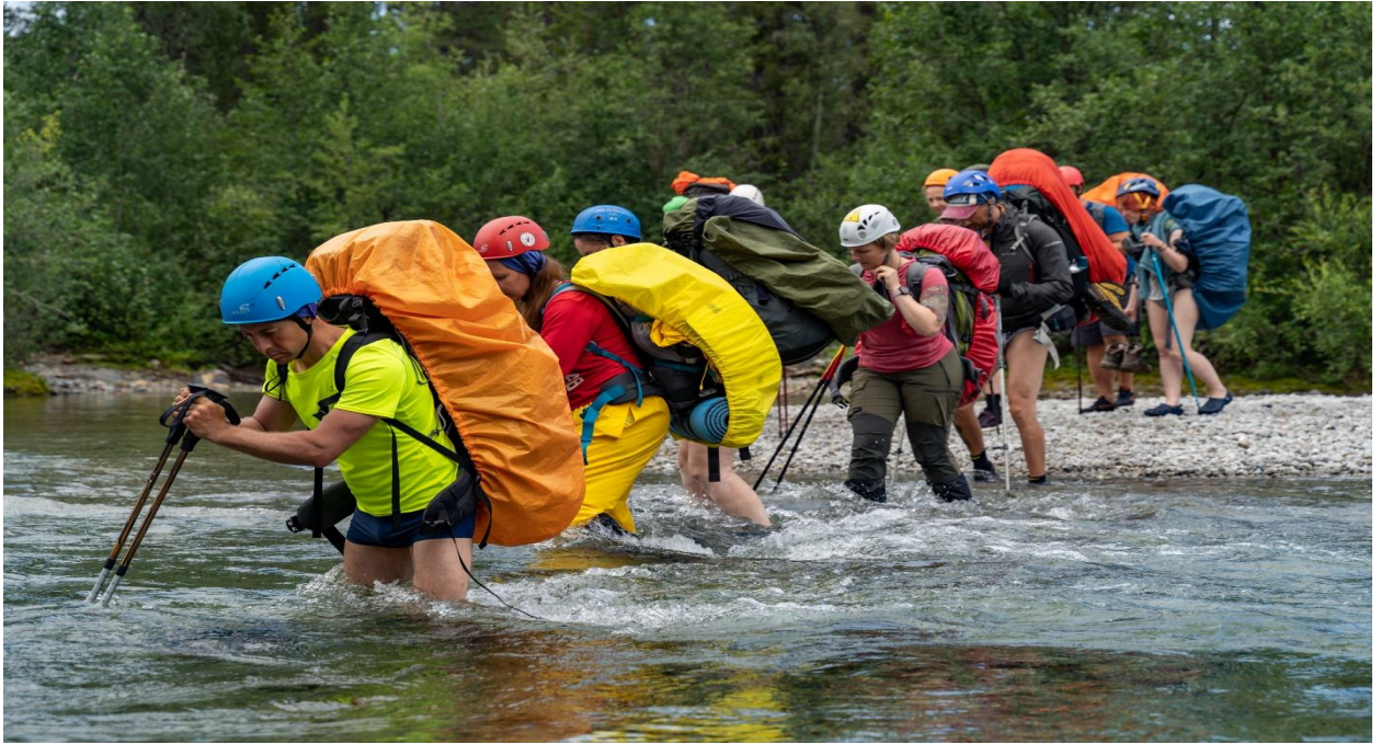
Фото 30: Брод через реку Касканюйок, ( 1А )

В 17:30 закончили переправу и уже в 18:00 начали ставить лагерь в месте с обустроенным костровищем. Развели костер, поужинали, пособирали ягоды, грибы, отбой в 21:00.