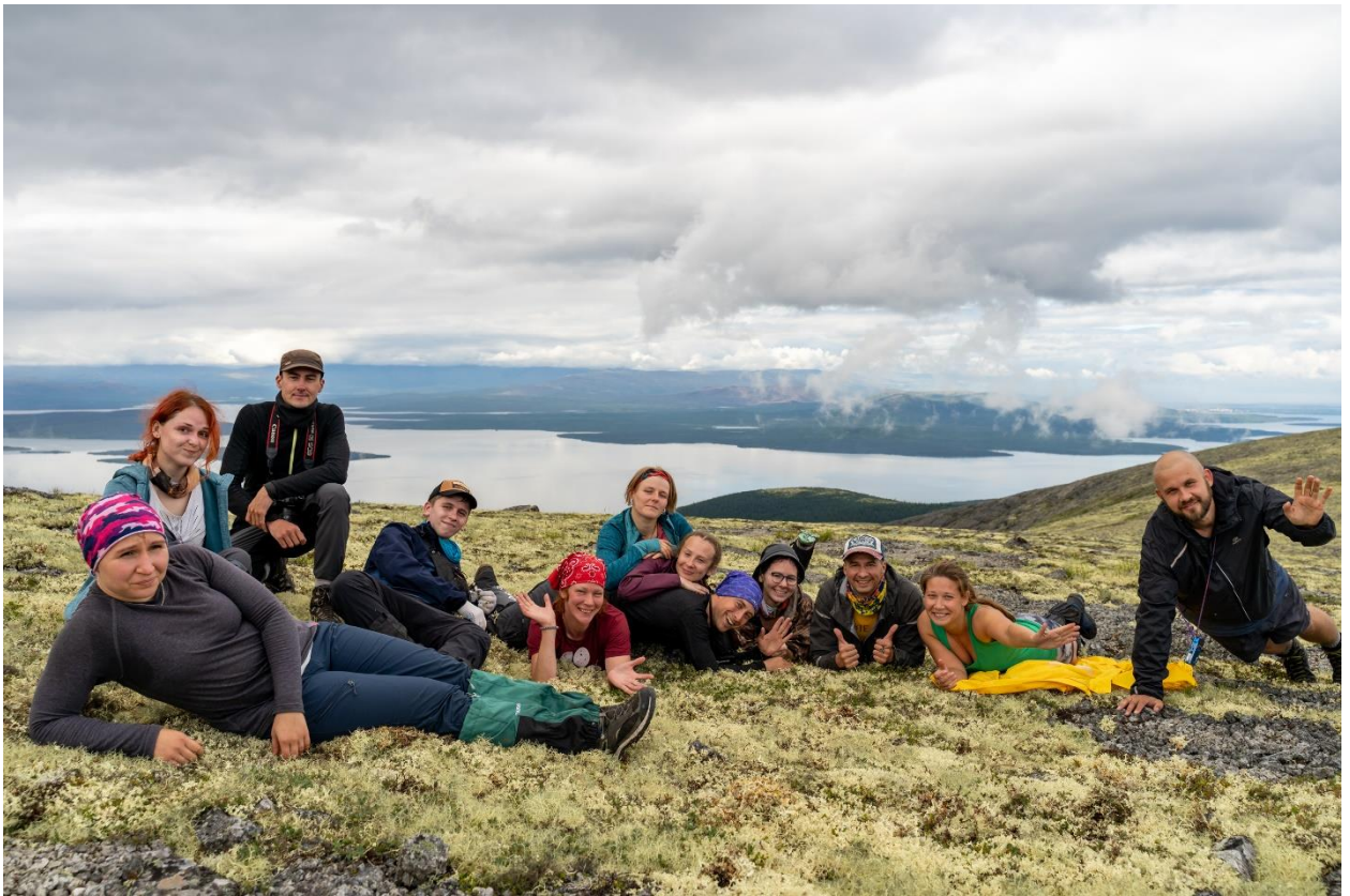
Фото 3: Группа на плато перед перевалом Хибинпахчорр.

После привала направились по северному склону реки Гольцовка траверсом через небольшое озеро, которого нет на карте (фото 4).