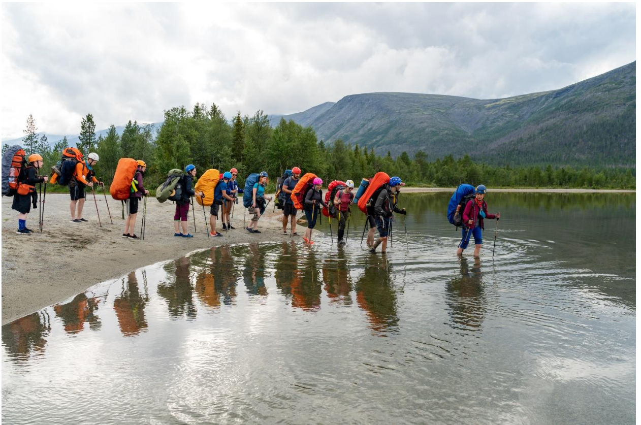
Фото 13: Брод протоки между озёрами Щучье и Гольцовое, (н/к.)