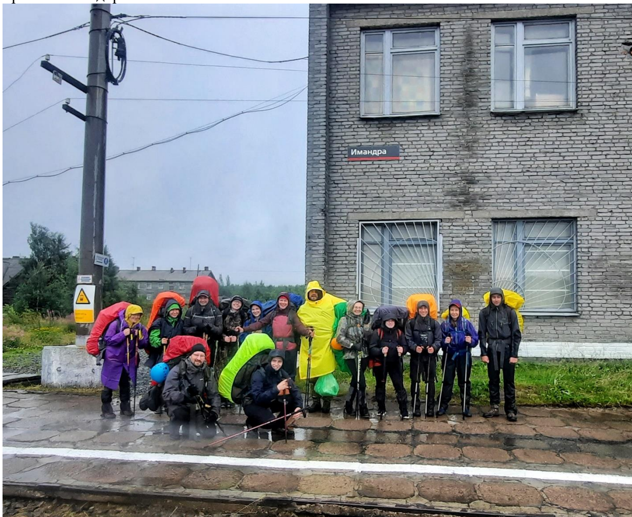
Фото 1. Группа в полном составе. ж/д Имандра. Начало маршрута.

В 18:36 вышли из поезда на станции Имандра (фото 1) группой в полном составе из 14 человек. Погода дождливая, температура +13. Утепились, написали в МКК, связались с местным ПСО, сделали стартовое фото и отправились вперёд по размытой от дождя просёлочной дороге.