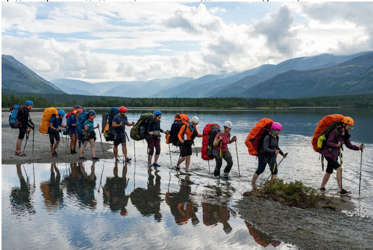
Фото 15: Брод устья реки Лявойок, (н/к)

1 до 5 метров, часть из которых можно просто перешагнуть, но некоторые приходится бродить. Уровень воды до 30 см, течение слабое, дно песчаное (фото 15).