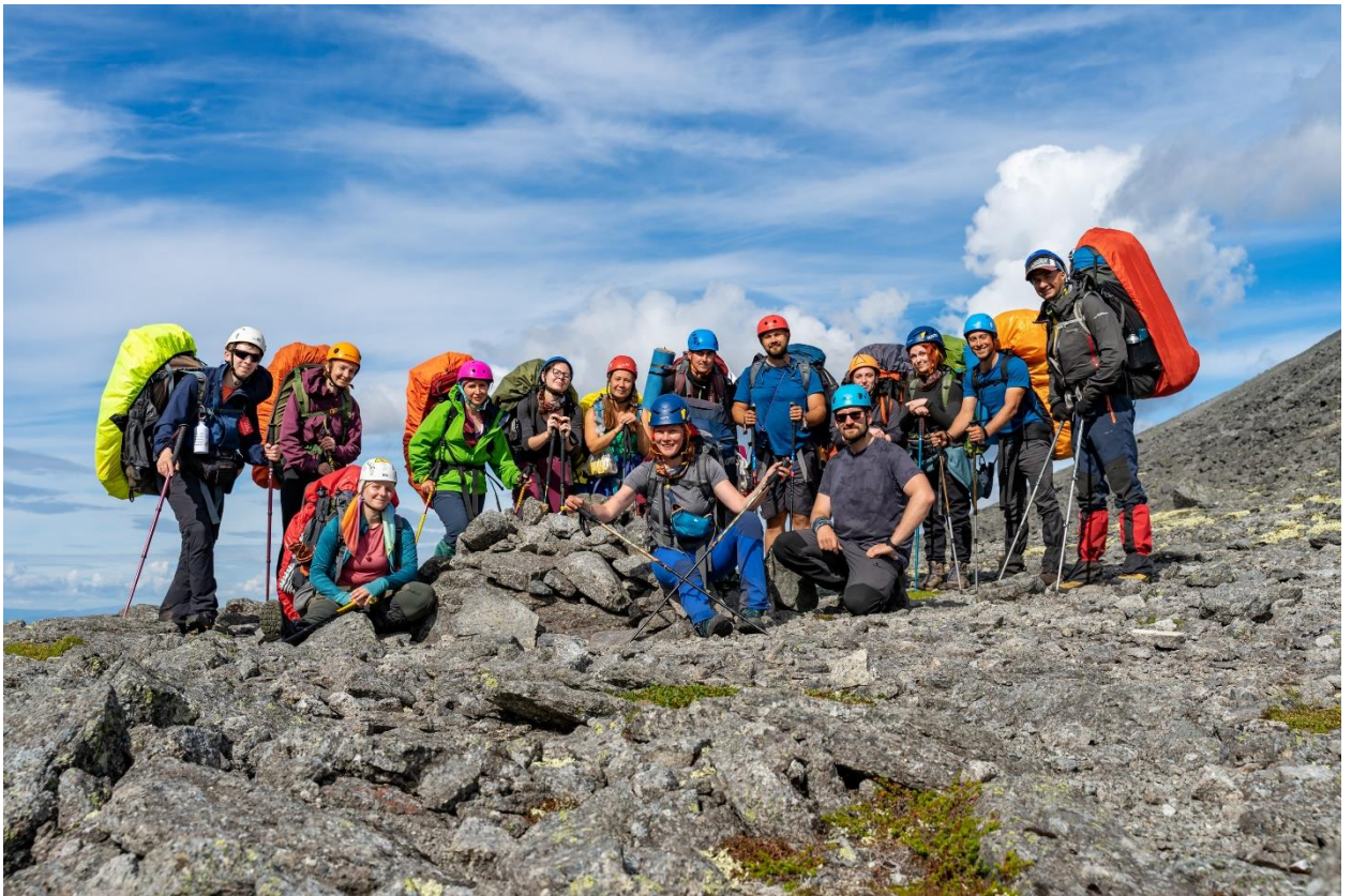
Фото 19: Группа на седловине перевала Партомчорр Северный, ( н/к)

На спуске, в направлении долины реки Майвальтайок мы обнаружили озеро, вокруг снежник, а внутри озера был лед, очень красивое природное явление (фото 20).