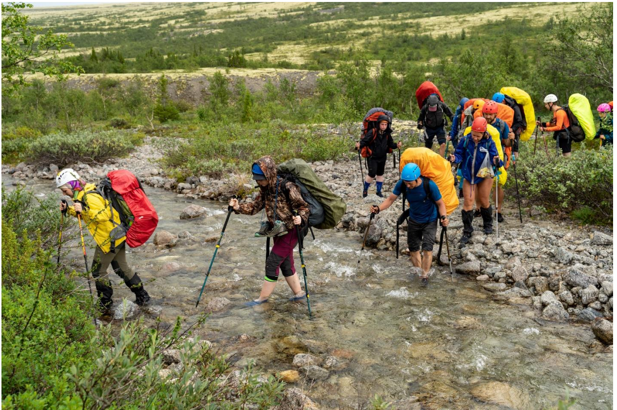
Фото 22: Переправа через левый приток со стороны перевала Олений реки Майвальтайок, (н/к)

После привала, в 17:00 начали движение к озеру Верхний Ньюръярв, по тропе по левобережной части долины. Через километр тропа сильно отклонилась и вывела на старую, уже заросшую просёлочную дорогу. В какой-то момент дорога превратилась в ручей, по которому бежала вода. По камням всё легко перешагивалось, ручей нисколько не мешал и в какой-то момент отклонился направо (фото 23).