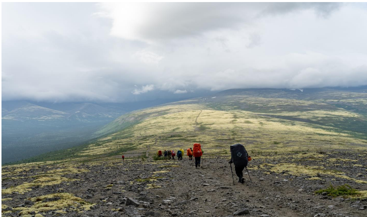
Фото 32: Характер пути по хребту Рыпнецк. Дорога на оз. Академическое

За один переход к 13:15 подошли к седловине перевала Куропачий, н/к, высота 430 метров Турик находится в стороне, правее по ходу движения.