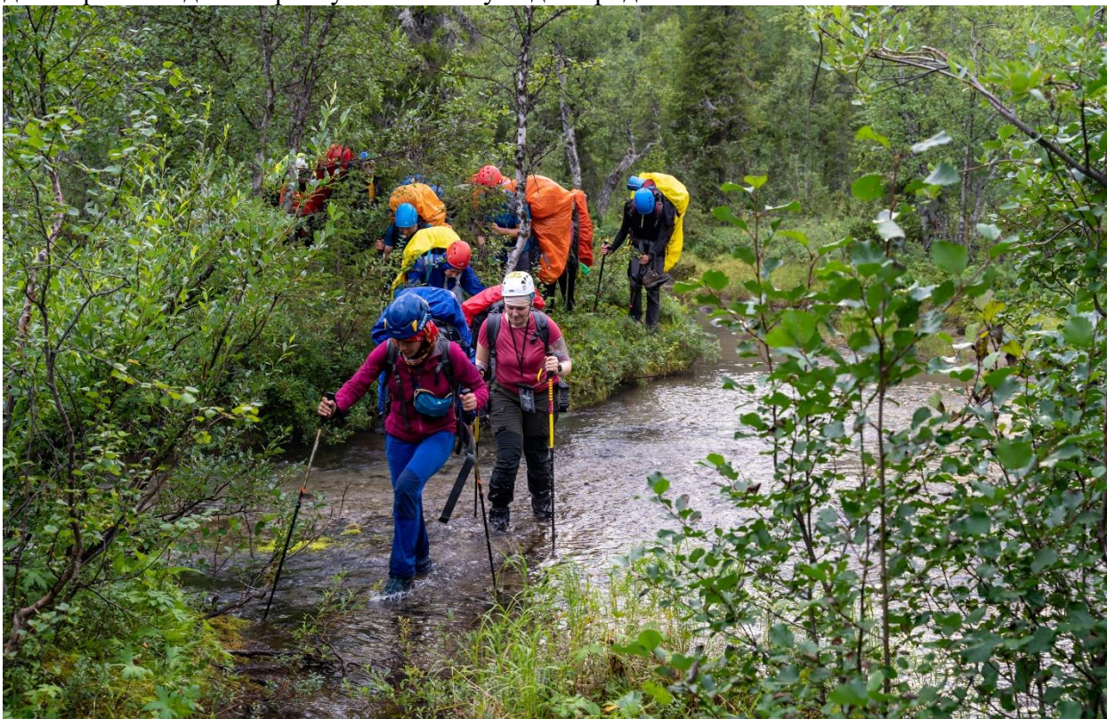
Фото 24: Переправа через второй левый приток реки Майвальтайок, (н/к.)

В 18:30 встретили ещё один приток реки Майвальтайок (фото 24,25). В этом месте приток сначала идёт в узком русле шириной 2 метра. Течение при этом чуть ниже среднего, а уровень воды 50-60 см. В русле подводные камни. Чуть ниже ручей разливается примерно на пять метров, здесь перепрыгнуть уже не получится, вода прозрачная, уровень 5-10 см, дно хорошо видно. Переобуваемся в обувь для бродов.