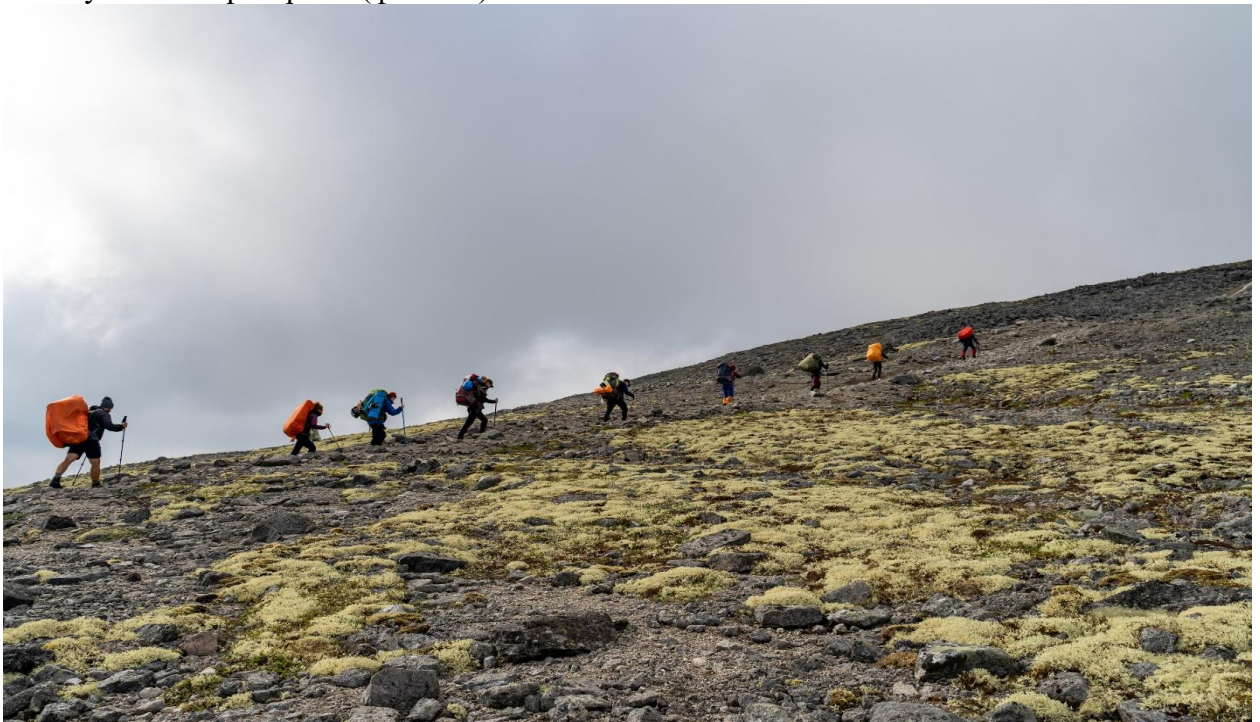
Фото34: Группа на подъеме над оз. Академическое.

Подъём в 07:00, выход в 09:00. Погода +14, солнечно, переменная облачность, сильный ветер. За один переход поднялись на плато над озером Академическое, сразу набирая высоту лёгким траверсом (фото 34).